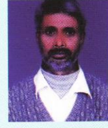
सुर्यभक्त मण्डारी वडाध्यक्ष ६