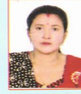
चन्द्रमाया परियार कार्यकारीणी सदस्य