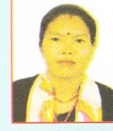
सुनसरी गुरुङ कार्यकारीणी सदस्य