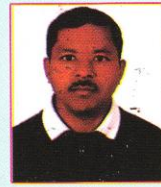
काजीमान श्रेष्ठ वडाध्यक्ष १४